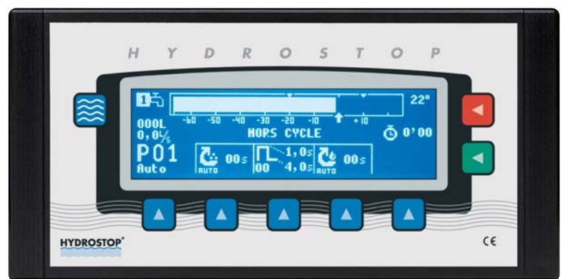
BOÎTIER INDICATEUR H2000