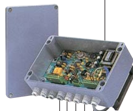
BOÎTIER ÉLECTRONIQUE DÉPORTÉ